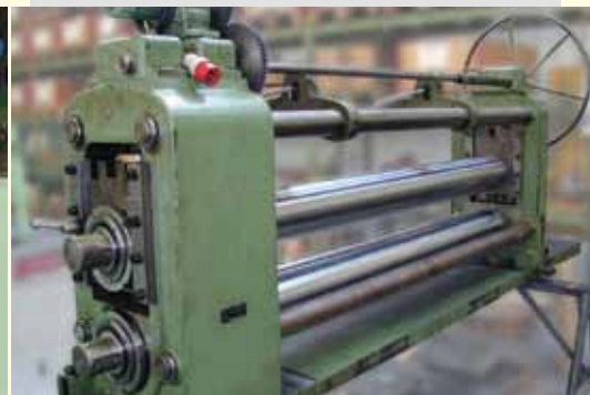
Revisionen von Fremdschere Refurbishment of all kind of slitters