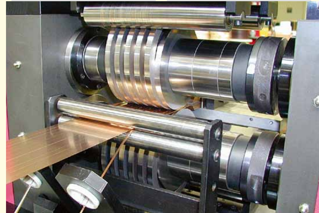
Schneiden mit Exzenter-Stahlauswerfferringen Cutting by using eccentric steel stripper rings

< Ausgelegt für optimale Bedienbarkeit < Designed for optimum operating comfort