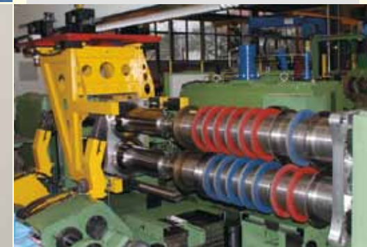
Automatische Werkzeugwechselsysteme Automatic tool changing units

< Ausgelegt für optimale Bedienbarkeit < Designed for optimum operating comfort