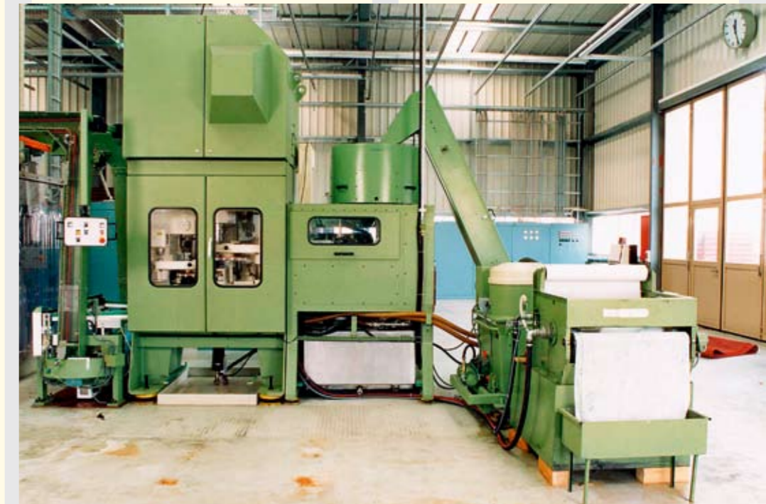
Kaltformpressen Прессы холодной текучести